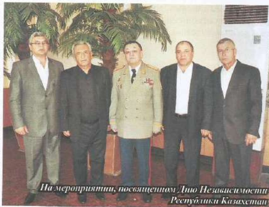
На мероприятии, посвященном Дню Независимости Республики Казахстан

годы все вместе взятое позволяет получать высокие урожаи. Он рачительный хозяин и бережно заботится о земле. За всем этим - увеличение налоговых отчислений в местный бюджет, рабочие места для сельчан, хороший достаток в их домах, забота о общем благе. Хозяйству «Агали» уже 16 лет и за это время оно стало в районе одним из самых крупных и успешных. Это наглядный пример для других.