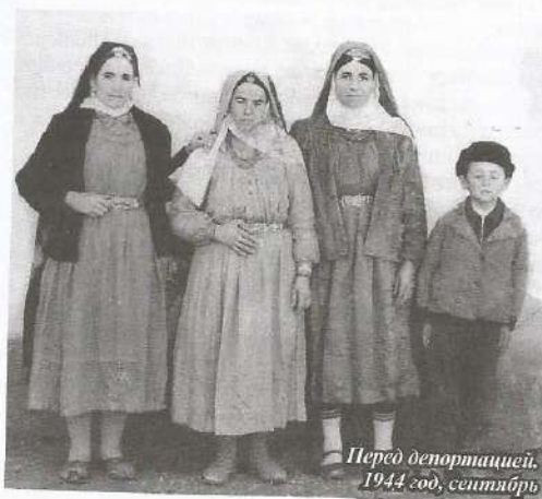
Перед депортацией. 1944 год, сентябрь