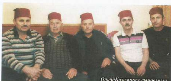
Отец Казимша с сыновьями