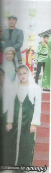
... (в центре)

...ской семье. ...селе Хагли Ахал- ...1928 году в селе ...испытать ...значит оказаться ...духом, не ...неизгоды и с на- ...месте. ...на кол- ...а Симизар, ...с концами, ...часть турков ...зслю, пере- ...к родине. А не-